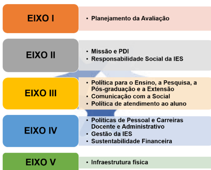
Figura 1 Dimensões do SINAES

Desta forma, os eixos de avaliação englobarão as dimensões conforme mostrado na figura a seguir.