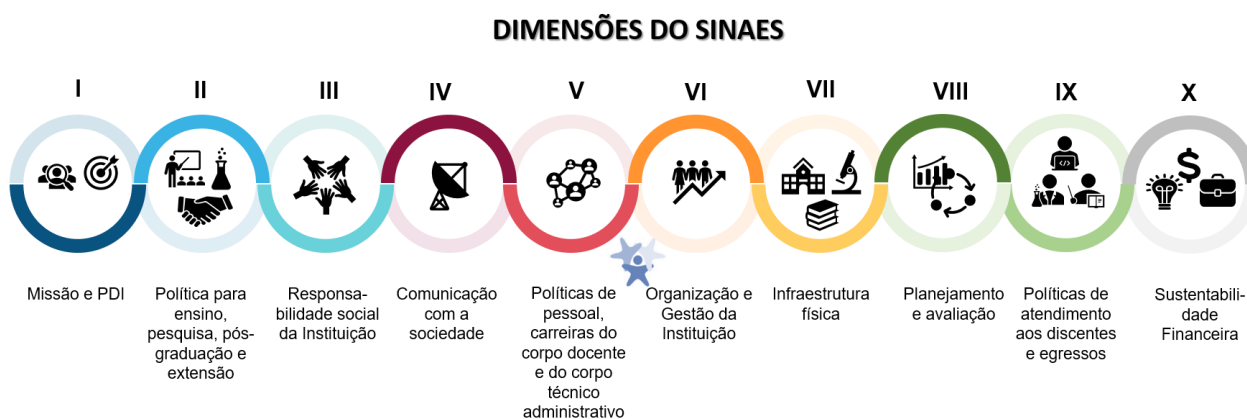
Figura 2 Dimensões do SINAES

Os processos de avaliação conduzidos pela CPA subsidiam os atos regulatórios institucionais e de cursos, bem como o desenvolvimento da instituição, sendo de competência e responsabilidade da CPA elaborar, a partir dos resultados apurados, o relatório de Autoavaliação pautado nas 10 dimensões que constam no SINAES conforme ilustrado abaixo.