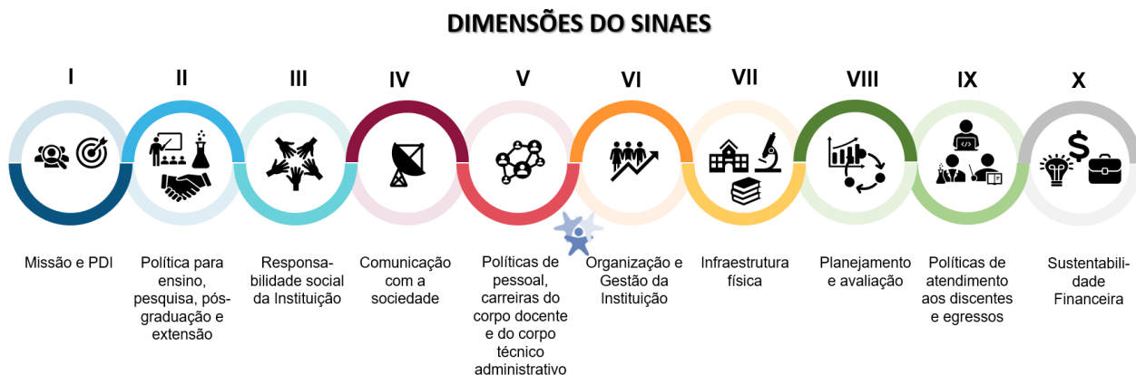
Figura 2 Dimensões do SINAES

Os processos de avaliação conduzidos pela CPA subsidiam os atos regulatórios institucionais e de cursos, bem como o desenvolvimento da instituição, sendo de competência e responsabilidade da CPA elaborar, a partir dos resultados apurados, o relatório de Autoavaliação pautado nas 10 dimensões que constam no SINAES conforme ilustrado abaixo.